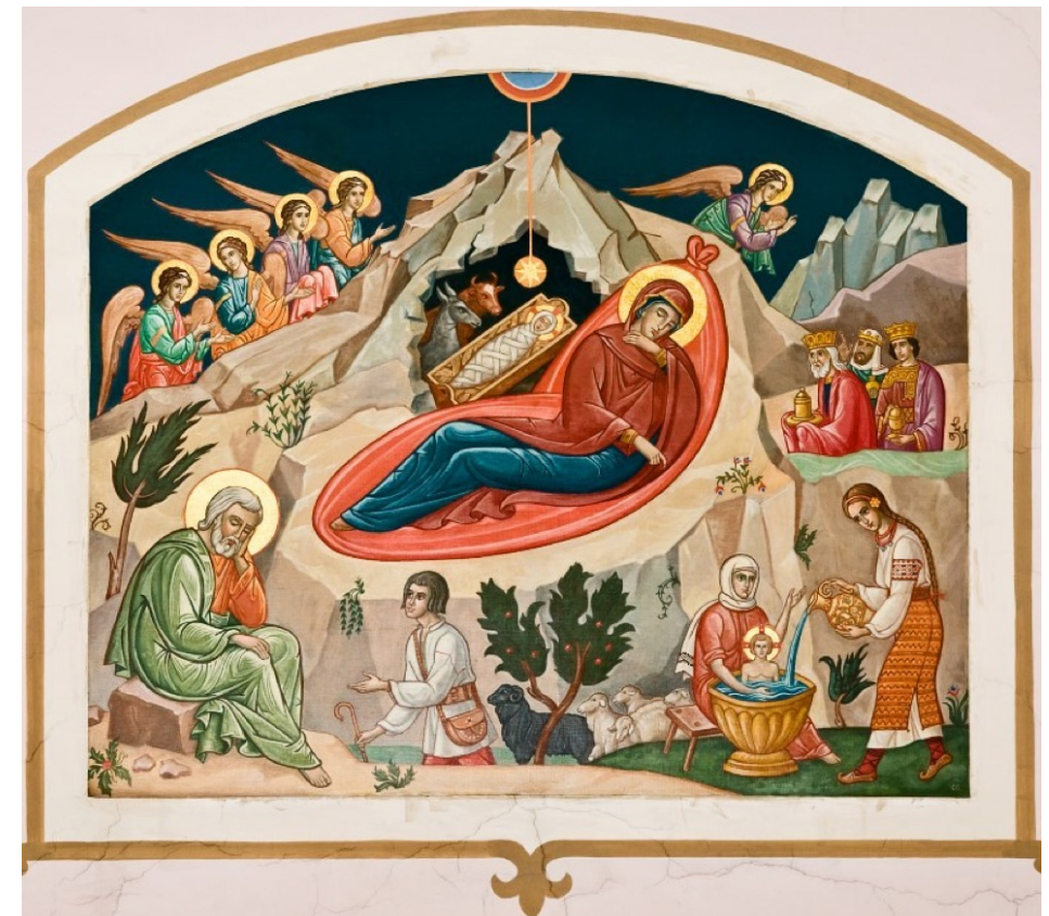
Byzantinische Ikone Geburt Jesu Christi

Ellingen - Fiegenstall - Stopfenheim - Weißenburg